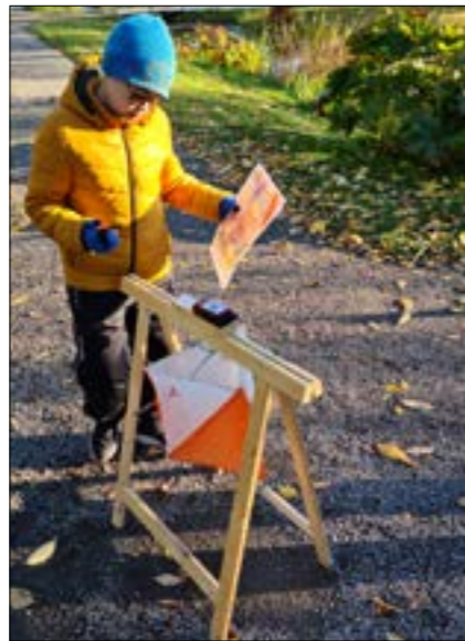
Deltagare har hittat fram till kontrollen

var en liten bit ifrån Munktelarenan, där övriga idrotter höll till, hade vi skapat en rutt i appen Microsoft Soundscape som deltagarna hade fått i förväg via mejl. Några provade detta och hittade till parken med hjälp av den 3D-ljudkarta som skapas i Soundscape. Rutten hade vi alltså skapat i förväg i ett speciellt program i datorn, som vi får testa av Microsoft.