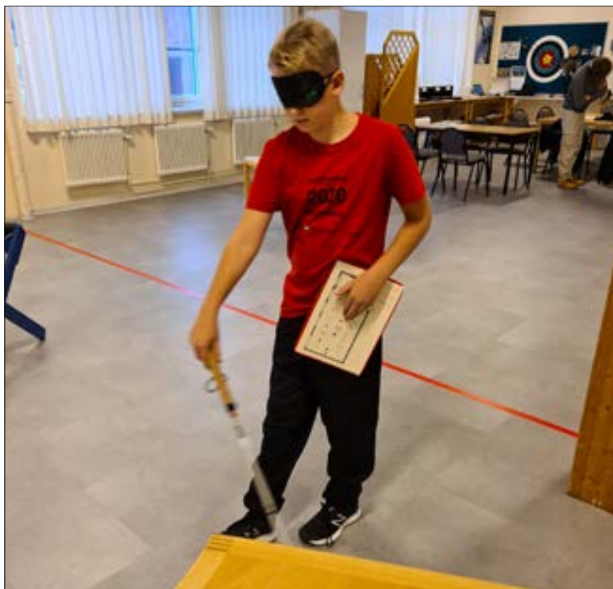
Deltagare orienterar med VägVisar-karta

Vi förberedde det hela några dagar innan genom att rita en karta i bågskyttehallen, som vi blivit tilldelade. Vi byggde sedan på plats upp en terräng med föremål från hallen som de sedan fick orientera sig i. Varje pass inleddes med kortare praktisk teori för att få förståelse för hur mycket de visste om kartor och för att förmedla det viktiga