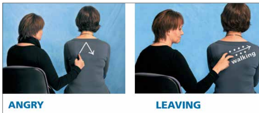
Manuell skrift på ryggen