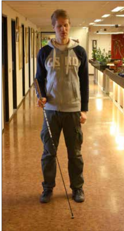
Ännu så länge svart – men slutversionen blir vit, och har ett nytt handtag.

Därför bedriver SRF Kronoberg sedan flera år med stöd av Arvsfonden ett utvecklingsarbete för att få fram en ny teknikkäpp som är lättare och säkrare än dagens käppar, vilket tidigare rapporterats i Nya synvärlden. Sedan vi efter flera års prov kommit fram till hur en ny bättre teknikkäpp borde vara konstruerad så samarbetar vi sedan augusti 2012 med företaget Produktutvecklarna i Växjö AB för konstruktion och tillverkning av prototyper till den nya käppen. Den första prototypen blev klar i maj-juni i fjol och testades under sommarmånaderna av undertecknad projektledare. Under hösten blev tre exemplar av version 2 klara; två av