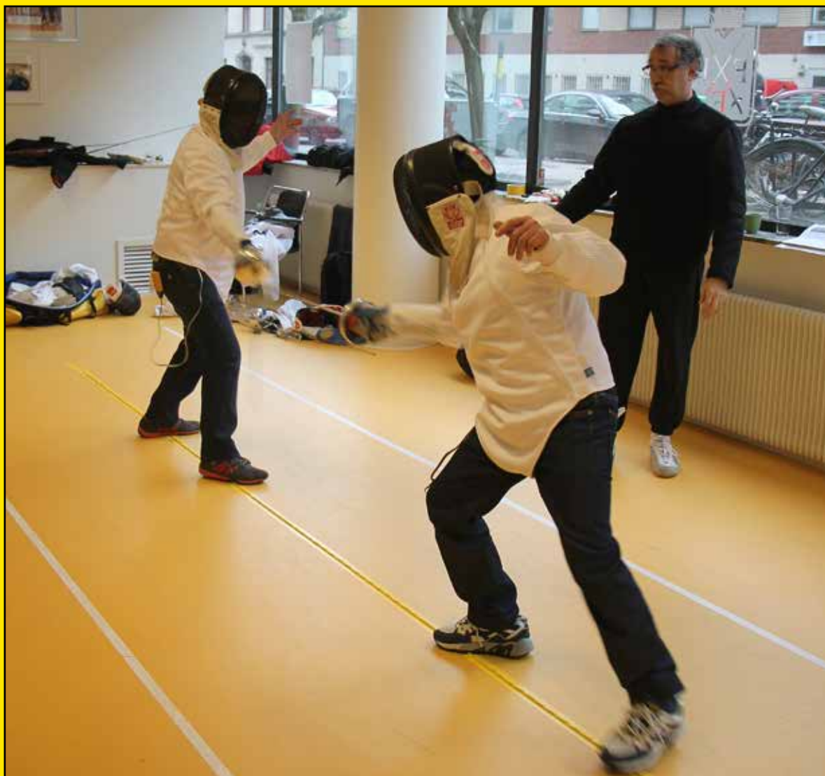
Fäktning för synskadade, sid 9

Tidskrift för fakta, debatt och utveckling kring synskaderehabilitering