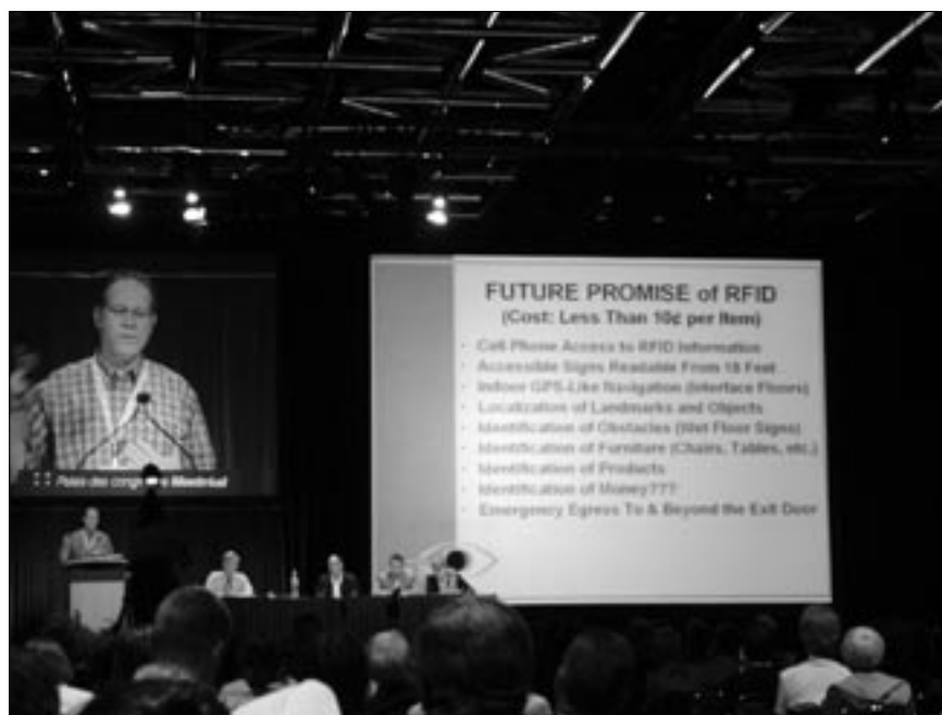
RFID-tekniken på frammarsch