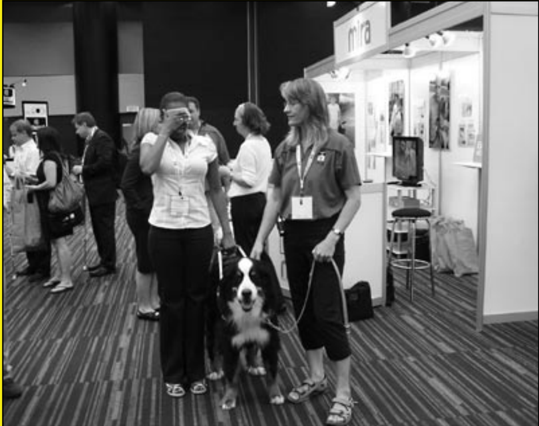
Ledarhund på Vision 2008 i Montreal, sid 14

Tidskrift för fakta, debatt och utveckling kring synskaderehabilitering